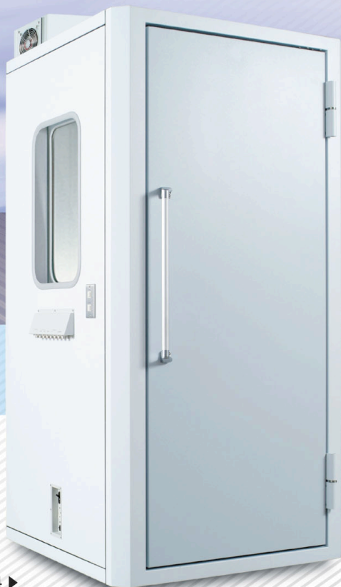
AT-64 ▶ 〈標準タイプ〉