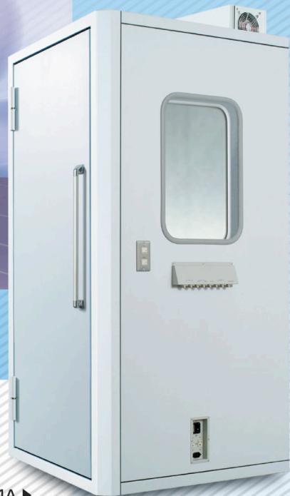
AT-64A ▶ 〈逆窓逆扉仕様〉