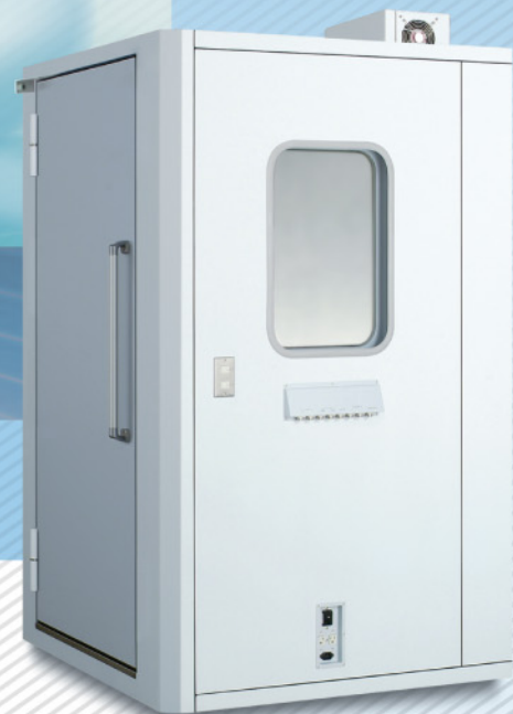
AT-66A ▶ 〈逆窓逆扉仕様〉