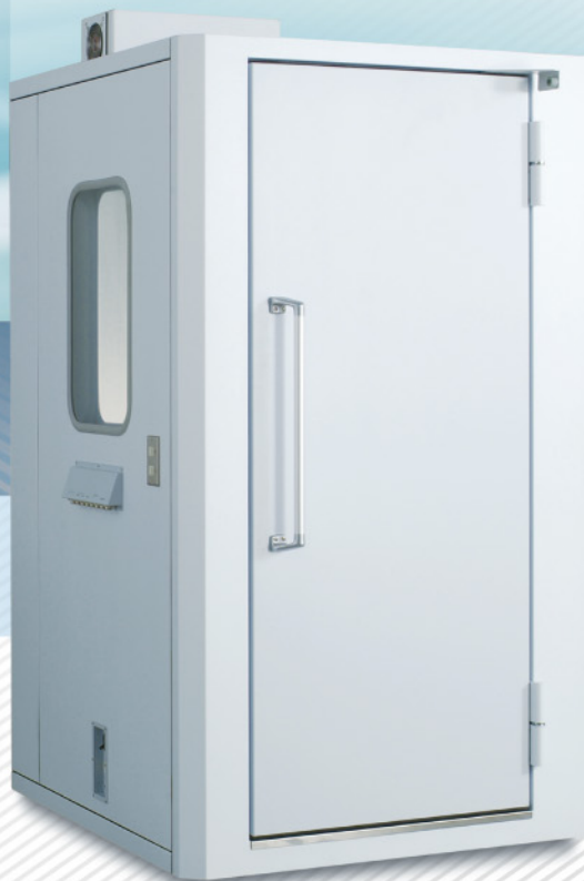
AT-66 ▶ 〈標準タイプ〉